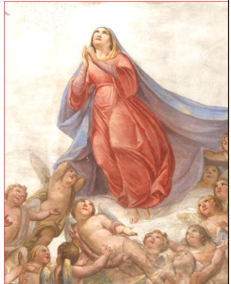
Assunta (soffitto chiesa di Loreggia)

Festa degli anniversari – Nella Festa dell'Assunta celebriamo gli anniversari di matrimonio. Auguri e benedizione del Signore a tutte le coppie!