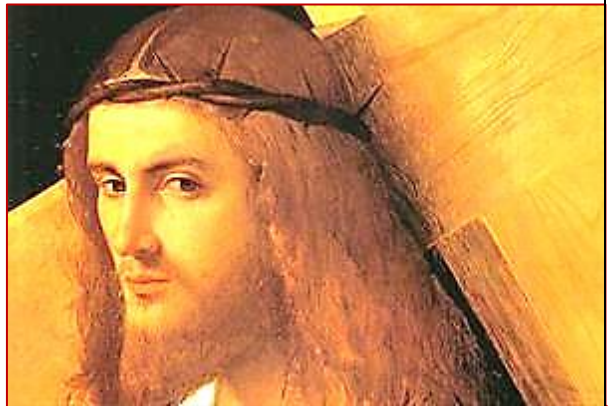
Cerchia di Giovanni Bellini, Cristo port la croce (1505-1510)

In quel tempo, Gesù partì con i suoi discepoli verso i villaggi intorno a Cesarèa di Filippo, e per la strada interrogava i suoi discepoli dicendo: «La gente, chi dice che io sia?». Ed essi gli risposero: «Giovanni il Battista; altri dicono Elia e altri uno dei profeti». Ed egli domandava loro: «Ma voi, chi dite che io sia?». Pietro gli rispose: «Tu sei il Cristo». E ordinò loro severamente di non parlare di lui ad alcuno. E cominciò a insegnare loro che il Figlio dell'uomo doveva soffrire molto, ed essere rifiutato dagli anziani, dai capi dei sacerdoti e dagli scribi, venire ucciso e, dopo tre giorni, risorgere. Faceva questo discorso apertamente. Pietro lo prese in disparte e si mise a rimproverarlo. Ma egli, voltatosi e guardando i suoi discepoli, rimproverò Pietro e disse: «Va' dietro a me, Satana! Perché tu non pensi secondo Dio, ma secondo gli uomini» (...).