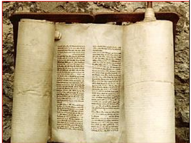
rotolo della Torah