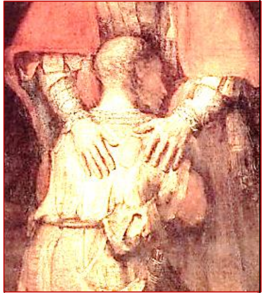
REMBRANDT, Il figliol prodigo

(...) Disse ancora: «Un uomo aveva due figli. Il più giovane dei due disse al padre: “Padre, dammi la parte di patrimonio che mi spetta”. Ed egli divise tra loro le sue sostanze. Pochi giorni dopo, il figlio più giovane, raccolte tutte le sue cose, partì per un paese lontano e là sperperò il suo patrimonio vivendo in modo dissoluto. Quando ebbe speso tutto, sopraggiunse in quel paese una grande carestia ed egli cominciò a trovarsi nel bisogno (...).