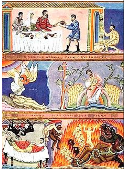
Lazzaro ed il ricco epulone, illustrazione dall'Evangelionario di Echternach