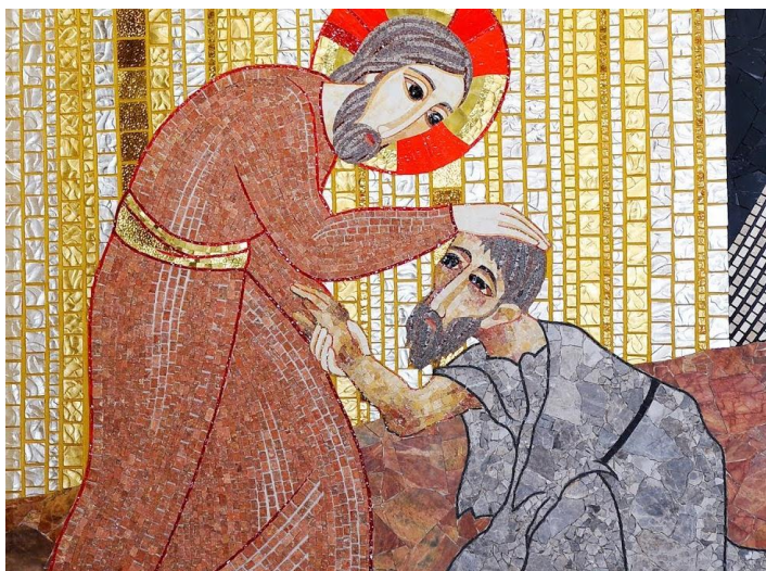
M. Rudnik, Gesù guarisce i lebbrosi (Cripta della Chiesa di San Pio)

Lungo il cammino verso Gerusalemme, Gesù attraversava la Samaria e la Galilea. Entrando in un villaggio, gli vennero incontro dieci lebbrosi, che si fermarono a distanza e dissero ad alta voce: «Gesù, maestro, abbi pietà di noi!». Appena li vide, Gesù disse loro: «Andate a presentarvi ai sacerdoti». E mentre essi andavano, furono purificati. [...] Uno di loro, vedendosi guarito, tornò indietro lodando Dio a gran voce, e si prostrò davanti a Gesù, ai suoi piedi, per ringraziarlo. Era un Samaritano. Ma Gesù osservò: «Non ne sono stati purificati dieci? E gli altri nove dove sono? Non si è trovato nessuno che tornasse indietro a rendere gloria a Dio, all'infuori di questo straniero?». E gli disse: «Alzati e va'; la tua fede ti ha salvato!».