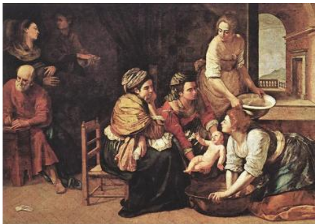
ARTEMISIA GENTILESCHI: Nascita di Giovanni Battista

Per Elisabetta si compì il tempo del parto e diede alla luce un figlio. I vicini e i parenti udirono che il Signore aveva manifestato in lei la sua grande misericordia, e si rallegravano con lei. Otto giorni dopo vennero per circoncidere il bambino e volevano chiamarlo con il nome di suo padre, Zaccaria. Ma sua madre intervenne: «No, si chiamerà Giovanni». Le dissero: «Non c'è nessuno della tua parentela che si chiami con questo nome». Allora domandavano con cenni a suo padre come voleva che si chiamasse. Egli chiese una tavoletta e scrisse: «Giovanni è il suo nome». Tutti furono meravigliati. All'istante si aprirono la sua bocca e la sua lingua, e parlava benedicendo Dio (...).