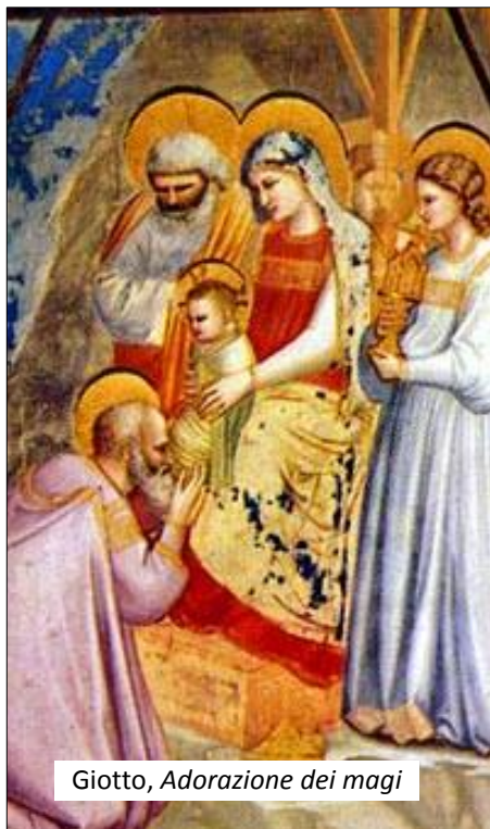
Giotto, Adorazione dei magi

In lui era la vita e la vita era la luce degli uomini. È venuto a portare vita, vita da vivere, vita che sia luce. Ciò che fa l'uomo «umano» è il respiro di Dio in lui.