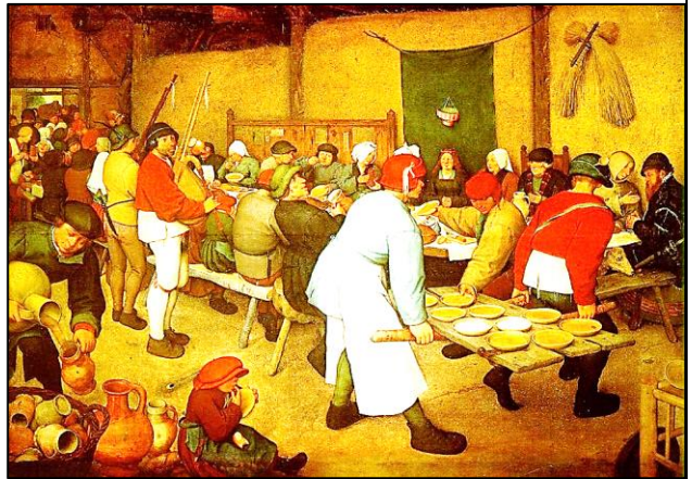
Pieter Bruegel, Banchetto nuziale(1568)

In quel tempo, Gesù disse ai suoi discepoli: «Come furono i giorni di Noè, così sarà la venuta del Figlio dell'uomo. Infatti, come nei giorni che precedettero il diluvio mangiavano e bevevano, prendevano moglie e prendevano marito, fino al giorno in cui Noè entrò nell'arca, e non si accorsero di nulla finché venne il diluvio e travolse