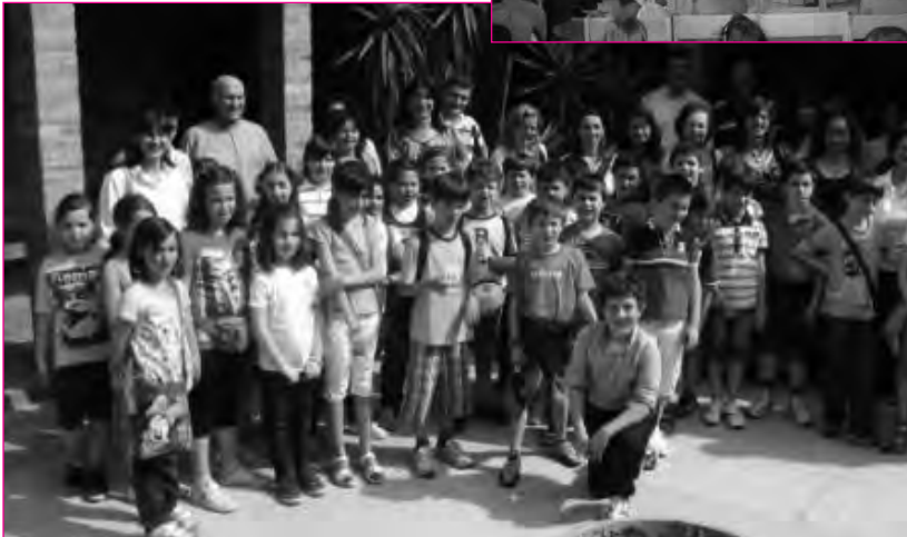
Pellegrinaggio a San Leopoldo