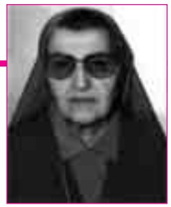
Religiosa da 73 anni

morta a Cormòns (Gorizia) il 25 luglio 2013