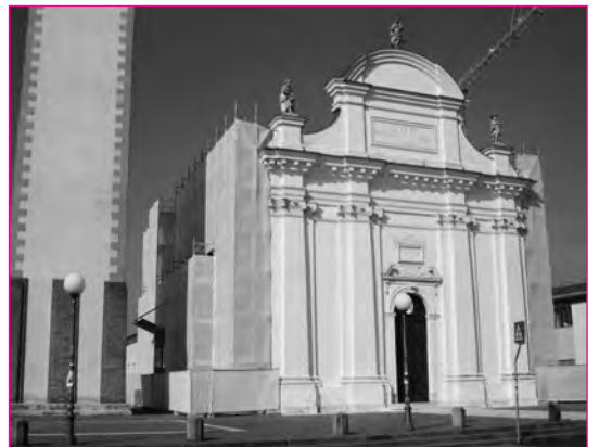
Una visuale dall'esterno oggi.