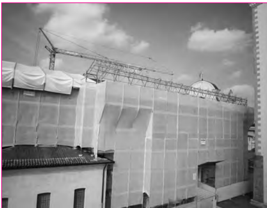
Sempre al lato nord, i ponteggi completati.