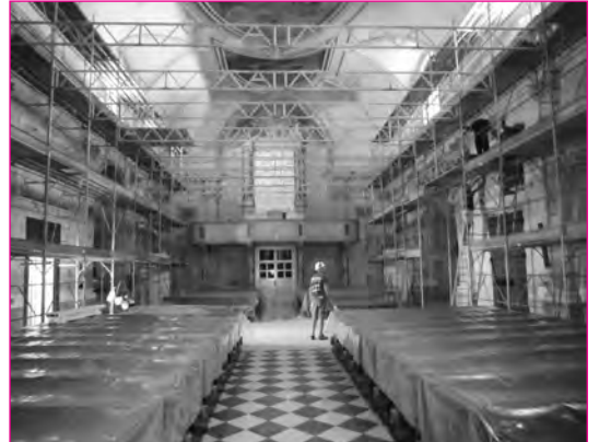
Stiamo completando i ponteggi sul soffitto.