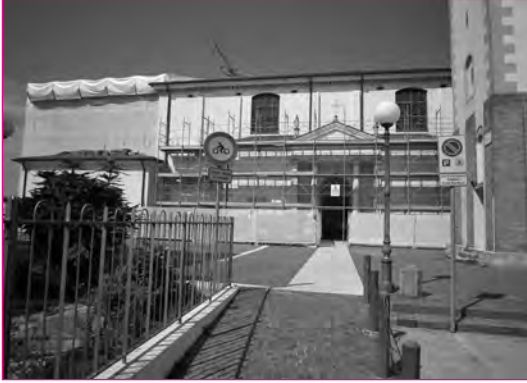
Iniziano i lavori all'esterno.