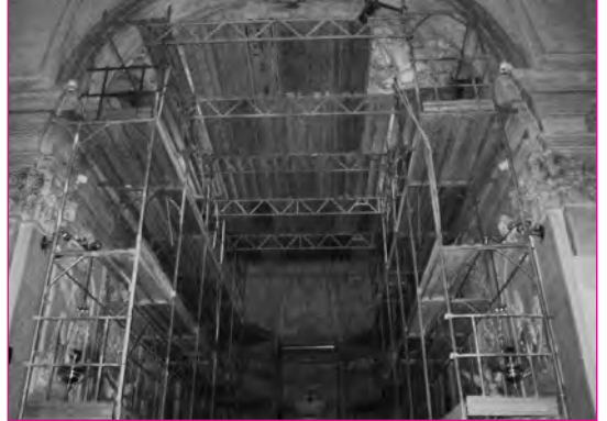
Qui siamo all'interno.