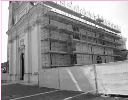
Ecco i ponteggi al lato nord.