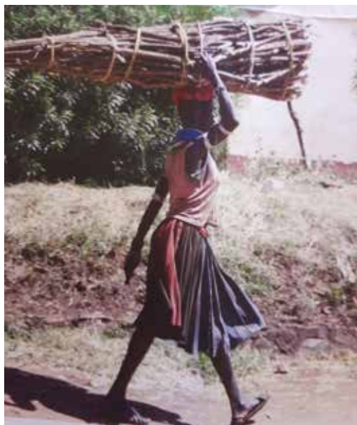
Uganda: giovane donna Karimojana va al mercato a vendere il suo fascio di legna per sfamare la sua famiglia