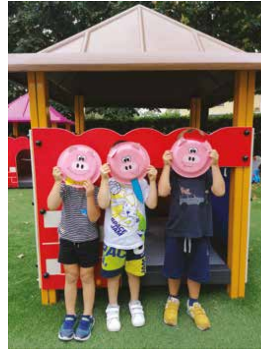
del Vangelo: "la casa sulla roccia" (Mt 24-27).

A rallegrare le nostre prime giornate d'inserimento sono stati tre simpaticissimi personaggi che hanno sempre affascinato i piccoli: i tre Porcellini con le loro tre casette di paglia, di legno e di mattoni. La simpatica storia ricca di insegnamenti per grandi e piccini verrà accostata alla Parola